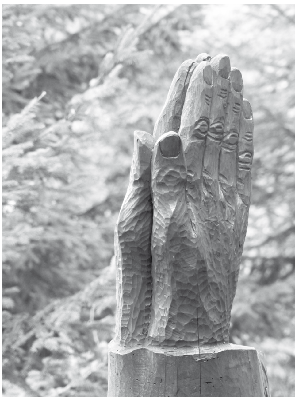
Sentier des statues, La Sagne, NE

JAB 1630 Bulle / 1618 Châtel-St-Denis 1680 Romont