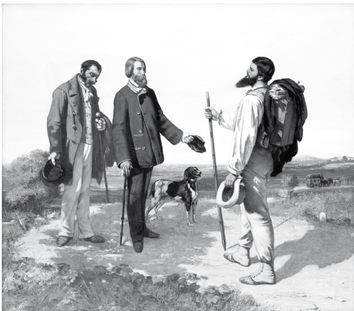
Gustave Courbet, La Rencontre, 1854, Musée Fabre à Montpellier.