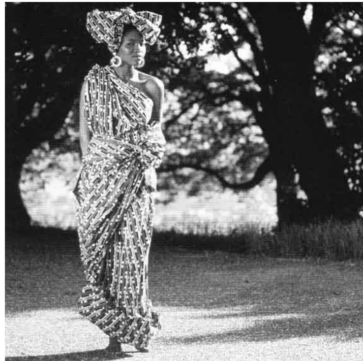
Elle a le sourire ... et le temps

Quant au dimanche, qu'on appelait volontiers le « jour du Seigneur », il est menacé d'asphyxie et certains milieux économiques le souhaitent ouvrable. Croyants et non-croyants devraient s'interroger ensemble sur le sens de la vie et sur la viabilité du monde, progressivement menacée.