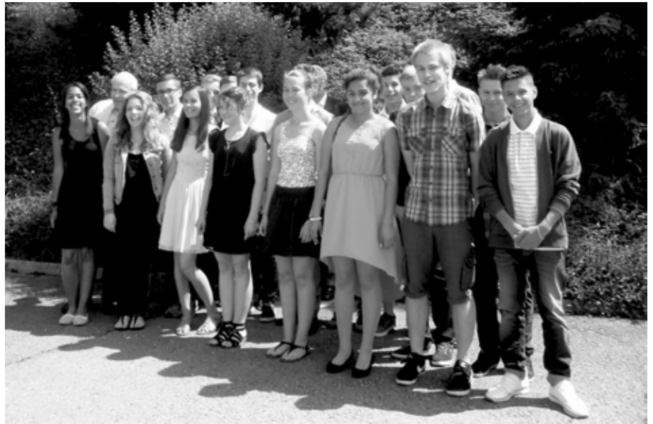
L'autre partie des jeunes de la volée 2015 (le 7 juin)

Les cultes de confirmations et de fin de catéchisme ont eu lieu au Gottau, à Châtel-St.-Denis, les dimanches 31 mai et 7 juin .