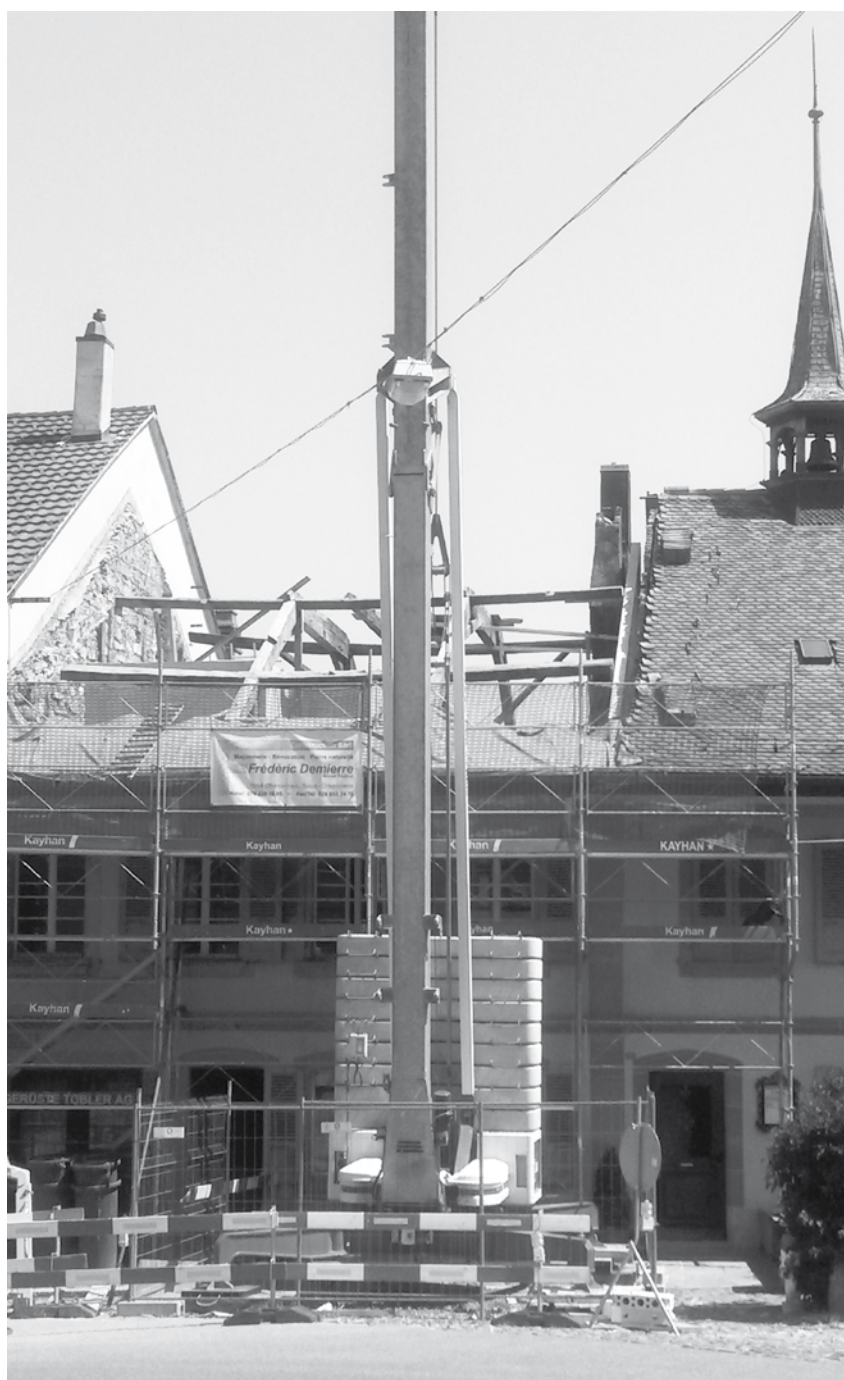
La maison de paroisse réformée à Romont se transforme

JAB 1630 Bulle / 1618 Châtel-St-Denis 1680 Romont