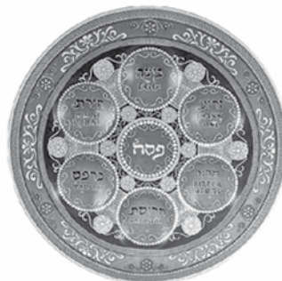
Plat pour le repas traditionnel du Seder.

Dimanche de Pâques 16 avril à 10h00 : culte de Pâques. Venez fêter la résurrection de Notre Seigneur et vous réjouir du salut qu'il nous offre.