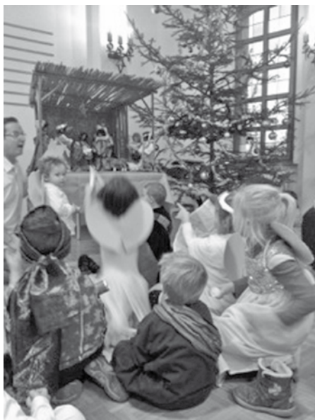
La fête de Noël de l'éveil à la foi, à la suite de l'étoile...

À 16h30 la célébration commence et elle se termine à 17h15.