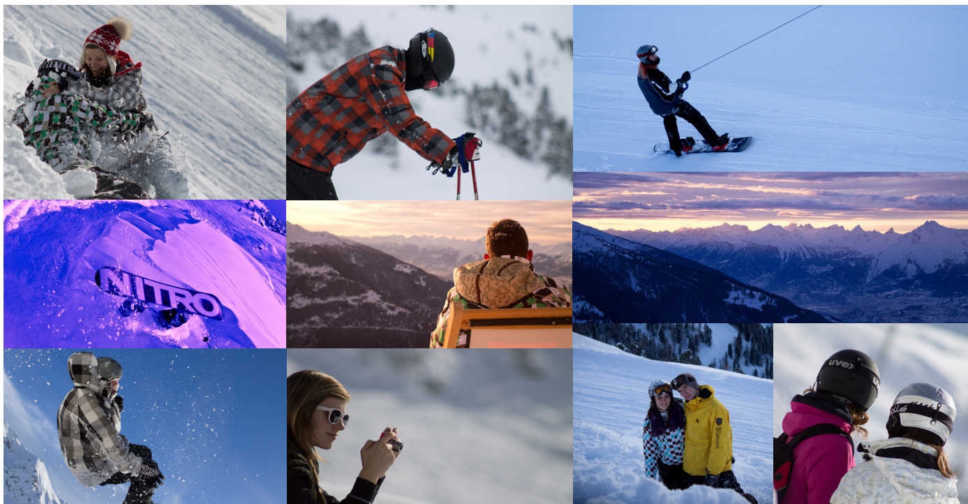
Les célèbres camps de ski de la paroisse à Chandolin rassemblent près d'une cinquantaine de jeunes chaque hiver.