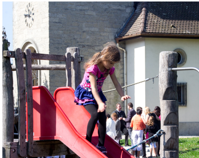
Le changement d'heure favorisera notamment la venue des familles.