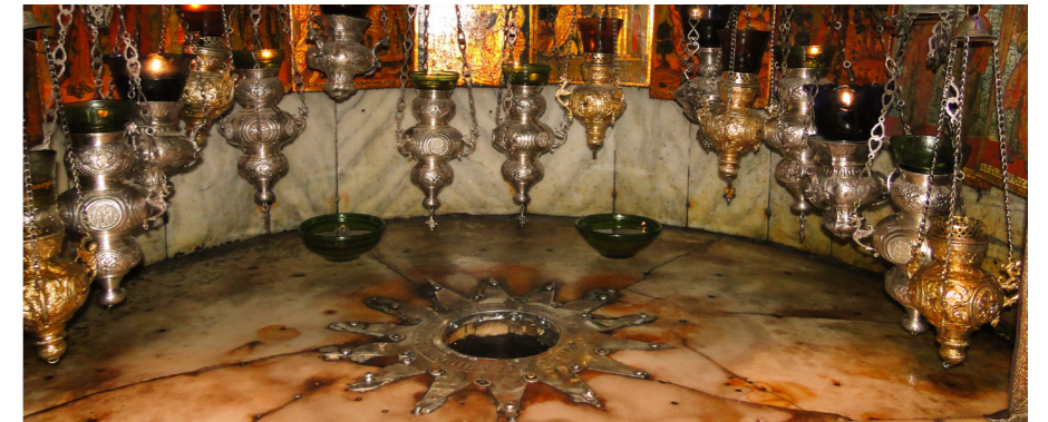
Dans la grotte sous la basilique de la Nativité à Bethléem, l'étoile indiquant le lieu où Jésus serait né.

Anne MAILLARD, Dimanche et fêtes chrétiennes. Histoire de leurs origines, Poliez-le-Grand : Éditions du Moulin, 1999.