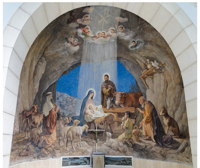
Illustration de la visite des bergers, église franciscaine au Champ des bergers à Bethléem.

* avec garderie (0 à 3 ans), école du dimanche (4 à 7 ans), explorateurs (8 à 12 ans)