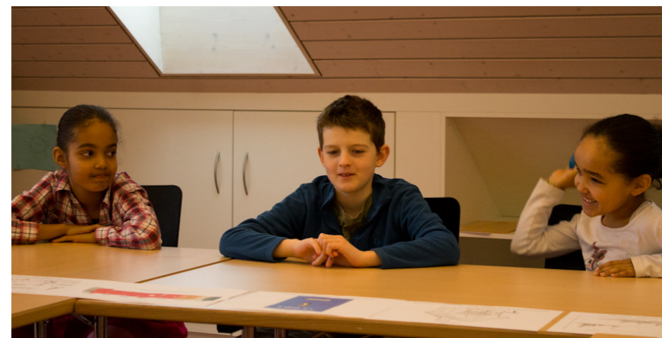
Pour éviter de parler tous ensemble, on se lance une balle. Une astuce tout aussi ludique qu'utile.