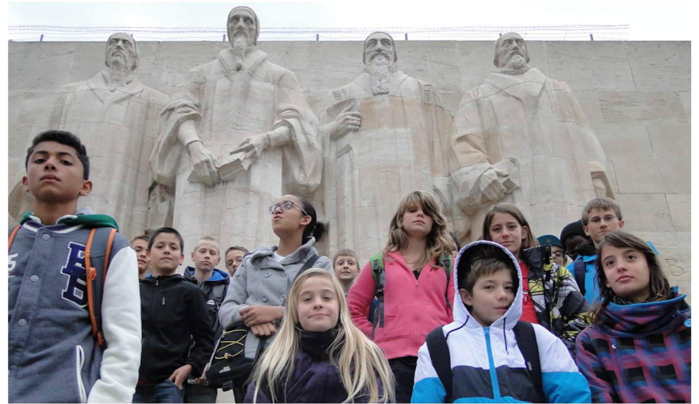
Nos catéchumènes face aux grands acteurs de la Réforme : un demi-millénaire les sépare.

D'un point de vue général, le recul protestant en Suisse