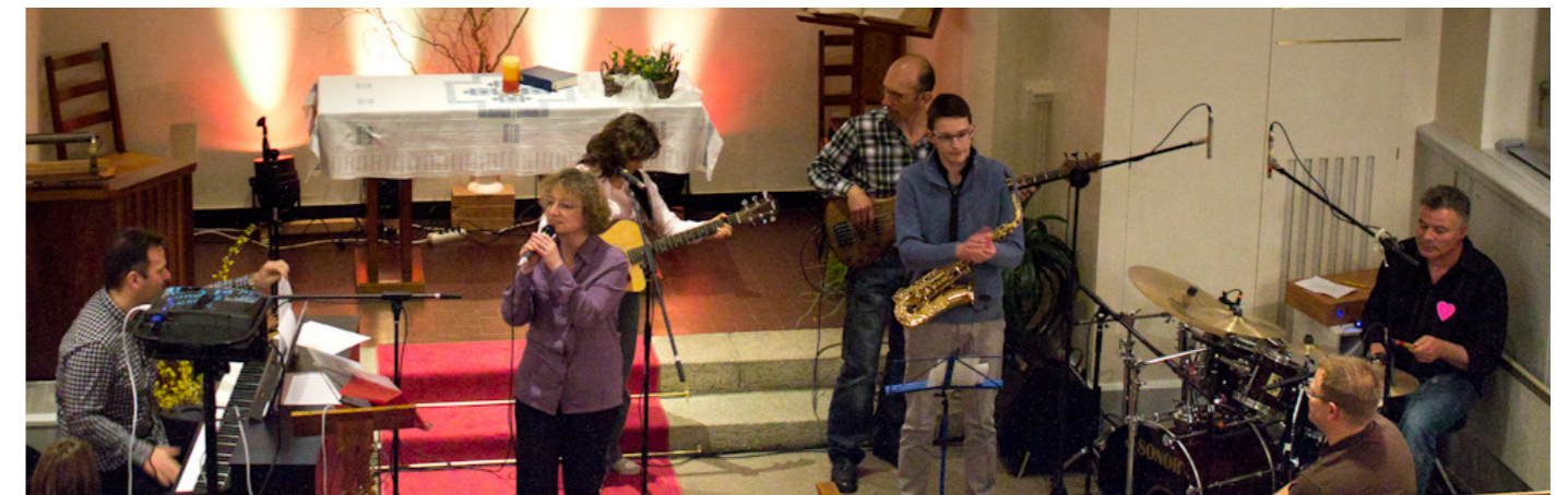
Guitare, basse, batterie, saxophone et piano comme alternative à l'orgue des cultes plus traditionnels : un moyen différent de vivre sa foi qui touche d'autres personnes.

Proposer des pistes concrètes pour vivre sa foi jour après jour est au cœur de la vocation des célébrations du soir.