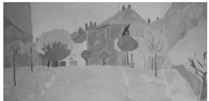
Rue de l'église, Romont, 1984, huile sur toile.

Contact et informations : Astrid Kaiser Trümpler 026 652 19 85, 079 714 22 67, astrid.stefan@bluewin.ch