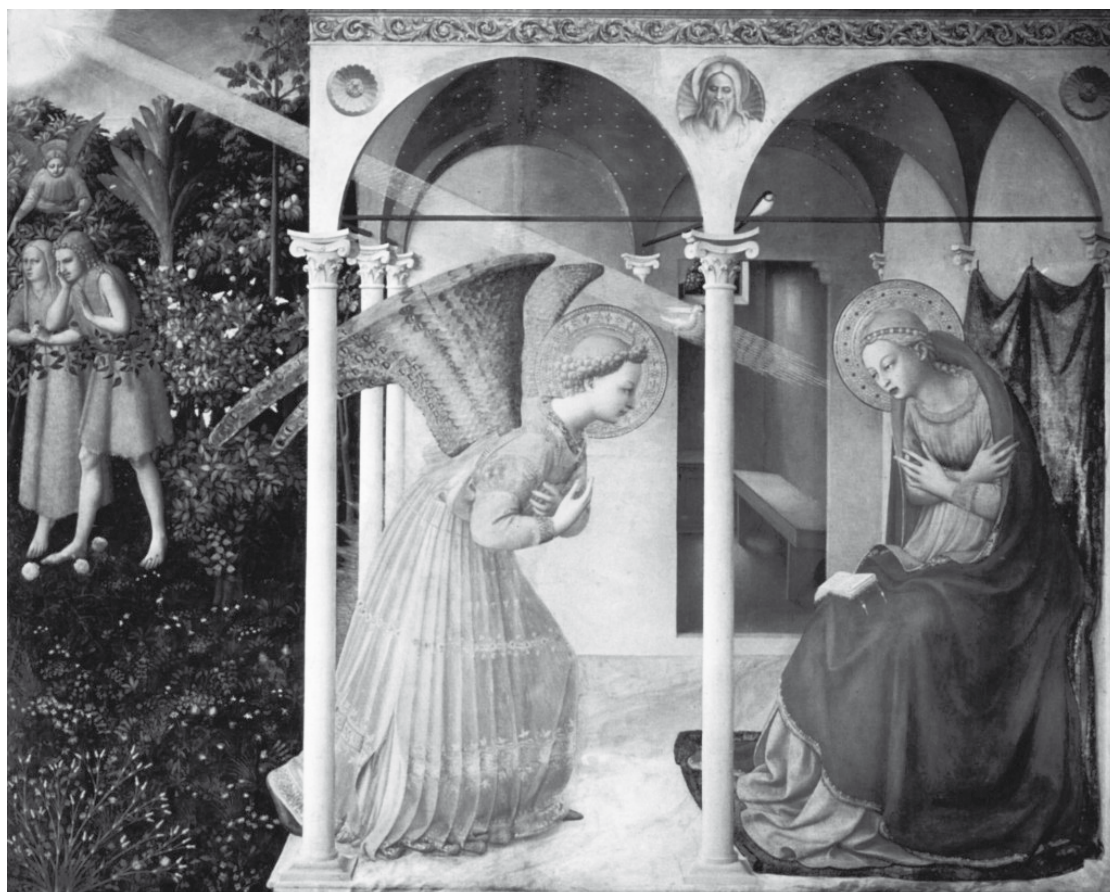
Visite de l'ange à Marie par Fra Angelico

1630 Bulle / 1618 Châtel-St-Denis 1680 Romont