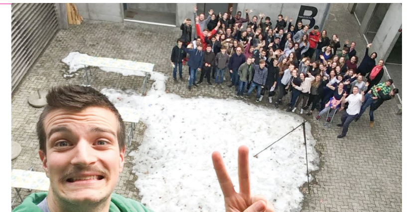
Photo des jeunes ayant participé au camp de Charmey. Concours : devinez où se trouve le coordinateur du groupe de jeunes. Indice : il fait un sourire crispé.