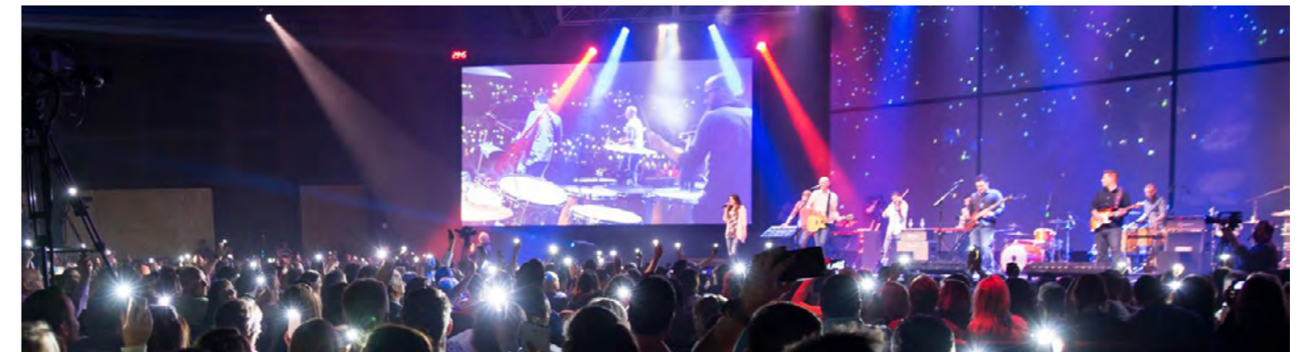
Photo: sur la forme et sur le fond, les religions se réinventent sans cesse

Rédacteur responsable de Protestinfo, Joël Burri partage trois filtres permettant de mettre en perspective tout ce qui se dit sur la religion. Article paru le 5 juillet sur www.protestinfo.ch [Article légèrement raccourci]