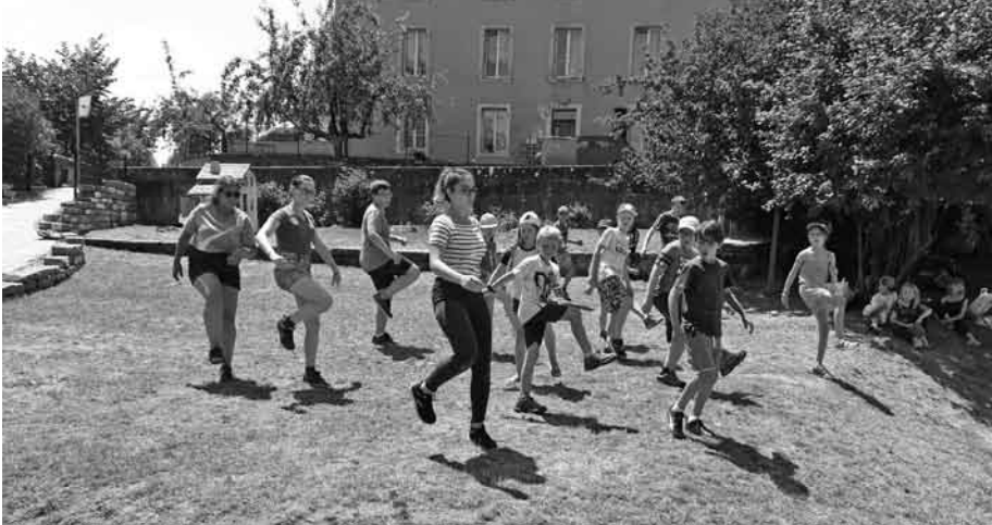
Une dernière danse pour les enfants du camp d'été

Du 9 au 13 juillet, un camp d'été pour les enfants s'est déroulé dans les locaux de la paroisse. Voici une photo-souvenir de la joyeuse équipe des participants et des animateurs !