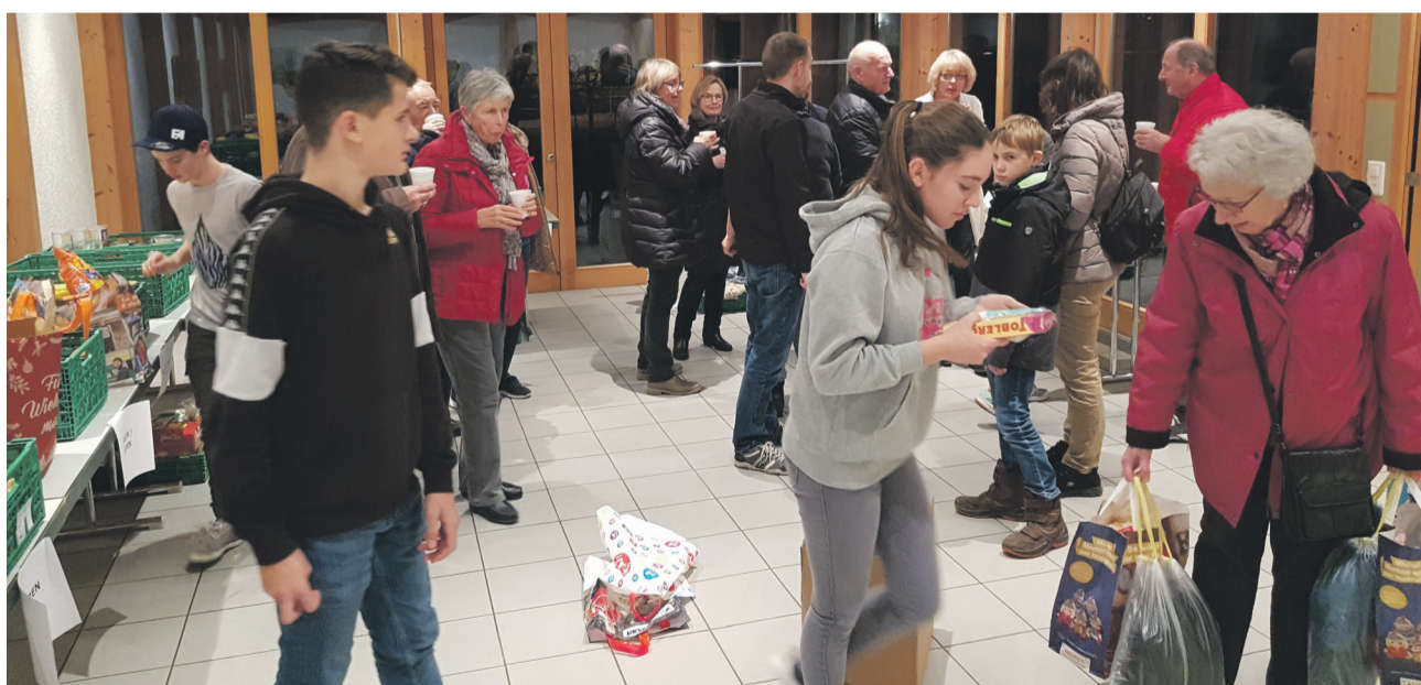
Das Einsammeln der gespendeten Ware - in Meyriez bei einem Becher Glühwein oder Punsch

Der Zieldurchlauf ist gelungen. Es war für uns alle eine rundum erfolgreiche Saison. Wir haben uns sehr gefreut, das Pfahlbaurdorf wiederum einem zahlreichen Publikum präsentieren zu dürfen und freuen uns alle auf den Saisonstart am 1. Mai 2019. Eing.