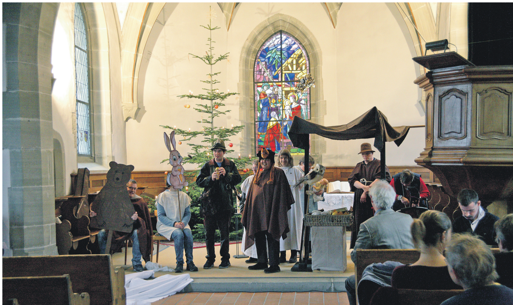
Eine klare Botschaft: Das Krippenspiel der SSEB-Mitarbeitenden öffnet Weihnachten für alle, egal ob Tiere, Menschen oder Engel.