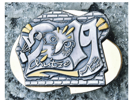
Die Supergold-Plakette der Murtner Fastnacht 2019

ner Fastnacht immer mit einem Sujetwagen. Im vergangenen Jahr erhielten sie den ersten Preis für das Sujet «Chaos um d'Tanksteu im Löiebärg». Die Ringmurechutze bestehen aus Mitgliedern zwischen 16 und 70 Jahren, die vorwiegend aus Murten, aber auch aus Bern und den Regionen Schwarzenburg und Seeland kommen. Ende Januar spielen sie am Inferno-Rennen in Mürren und Anfang Februar am Guggenmusiktreffen in Buttisholz. Die Murtner Fastnacht findet vom 2. bis 4. März 2019 statt.