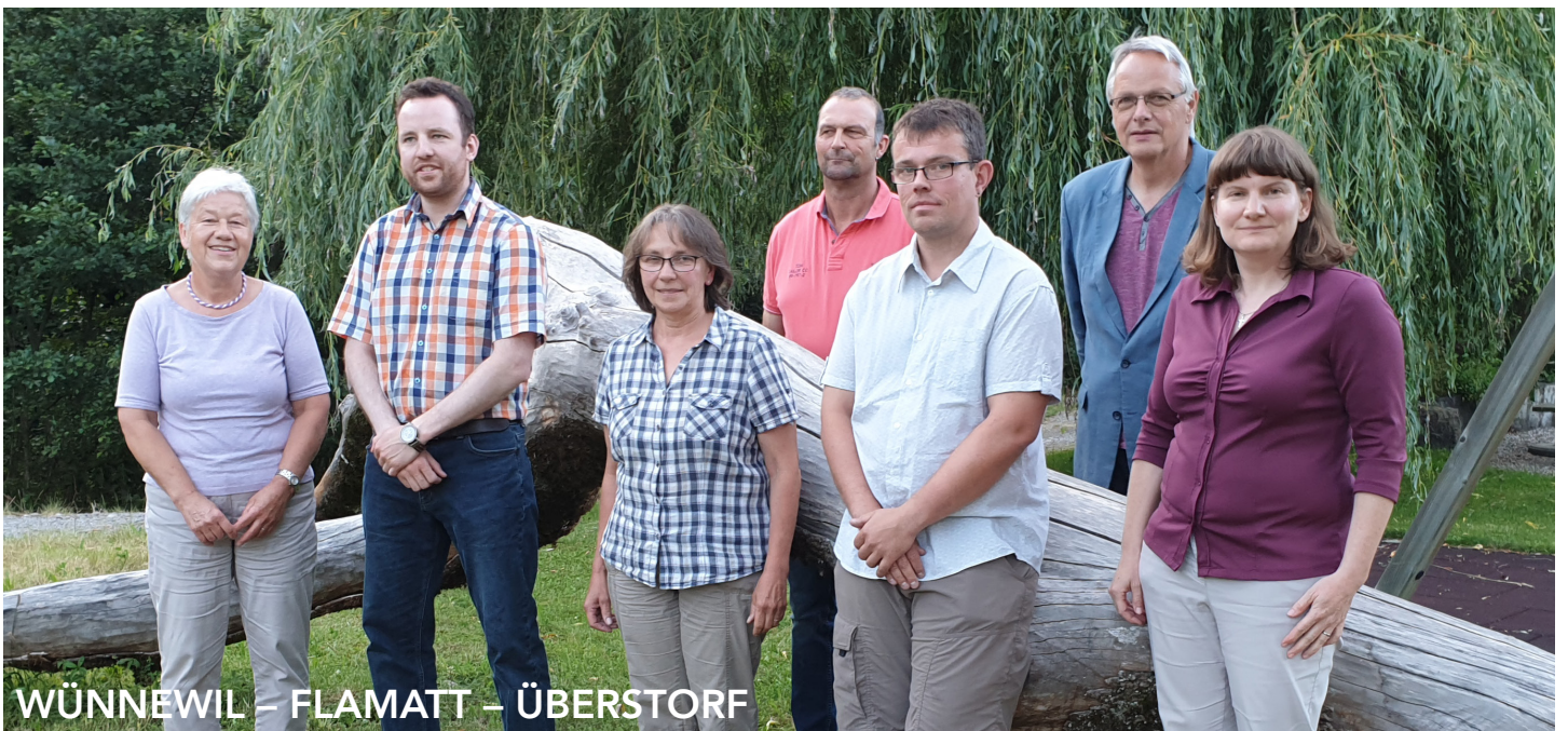
WÜNNEWIL – FLAMATT – ÜBERSTORF