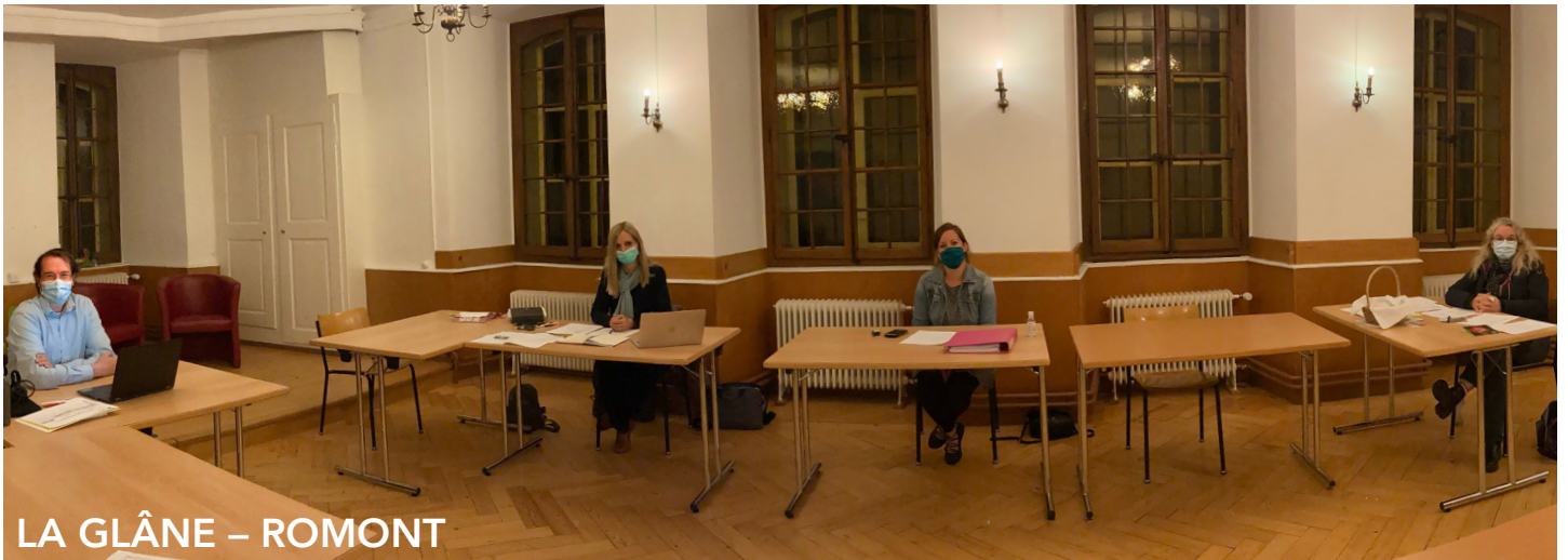
LA GLÂNE – ROMONT