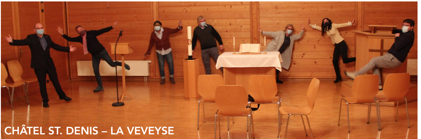
CHÂTEL ST. DENIS – LA VEVEYSE