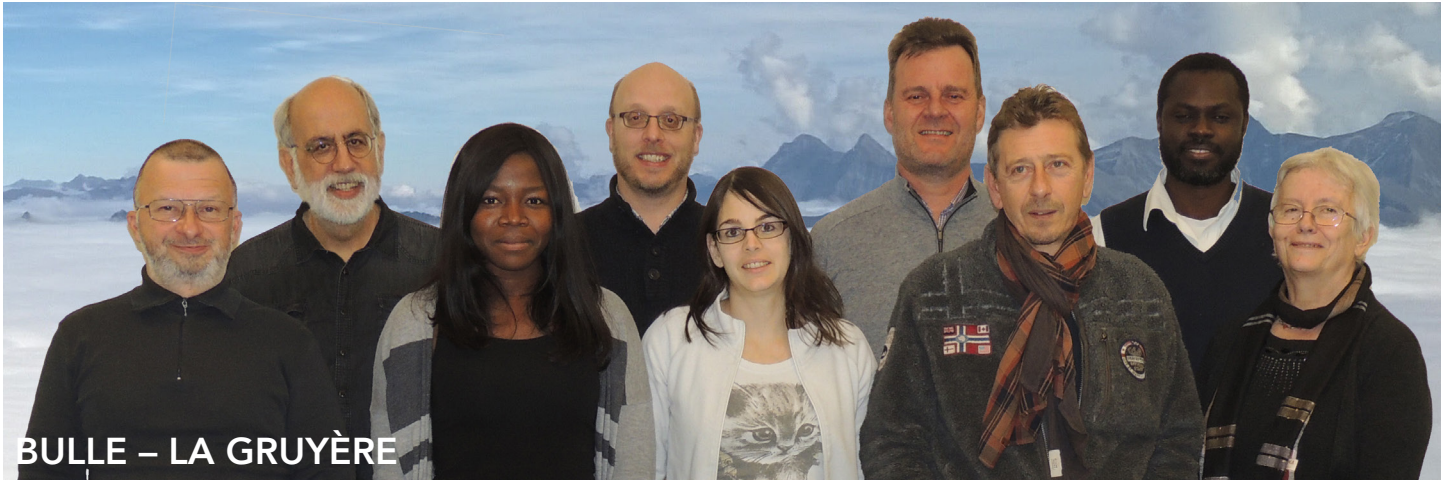
BULLE – LA GRUYÈRE