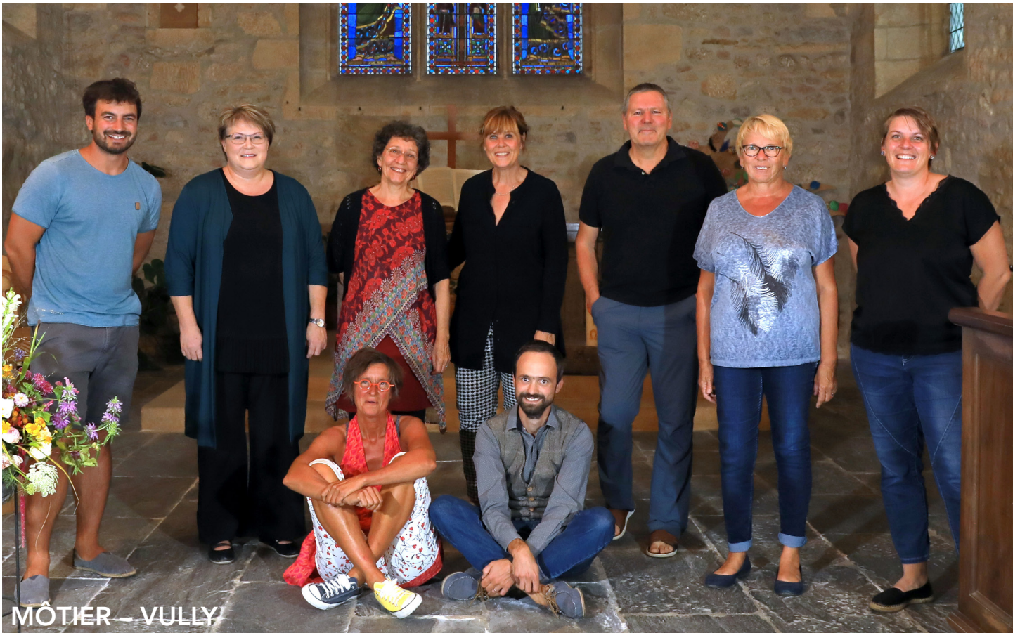
MÔTIER – VULLY