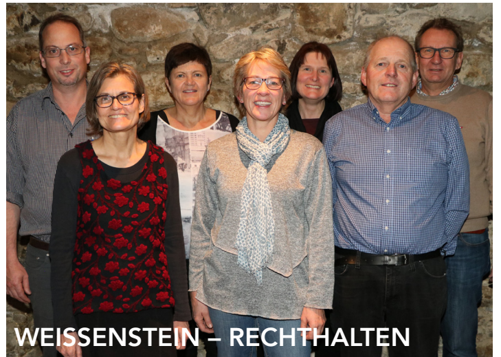
WEISSENSTEIN – RECHTHALTEN