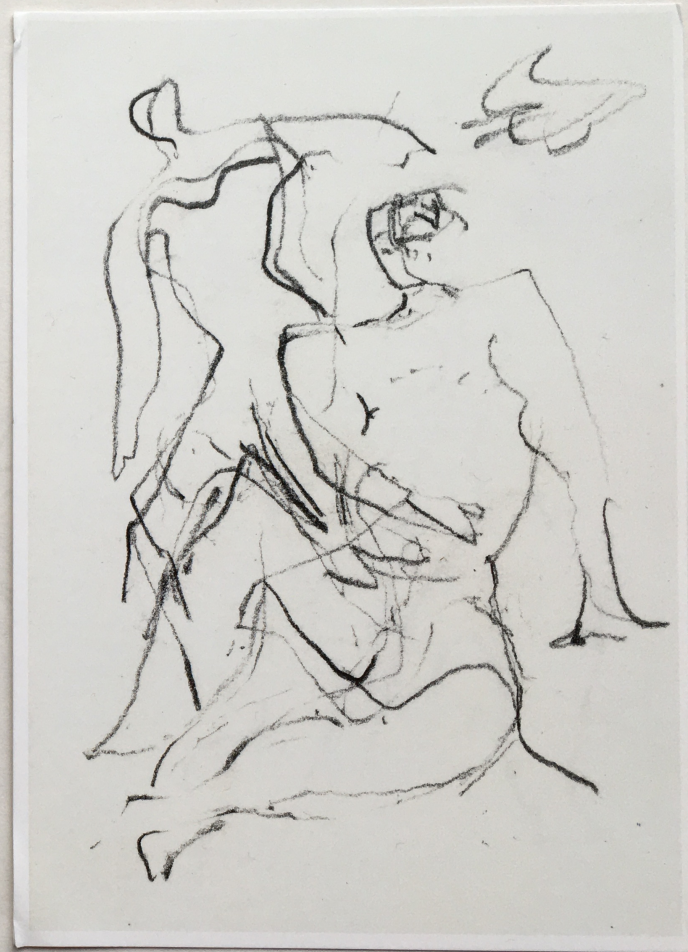
Hermann Lindner - Zwei Figuren (Graphit auf Papier 2000)