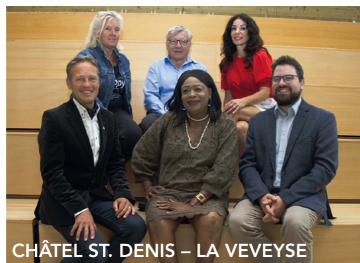
CHÂTEL ST. DENIS – LA VEVEYSE