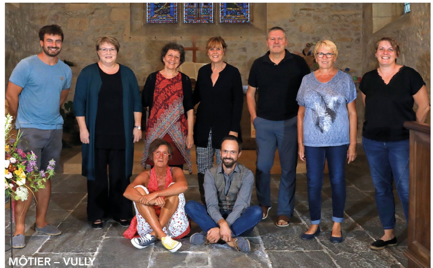
MÔTIER – VULLY