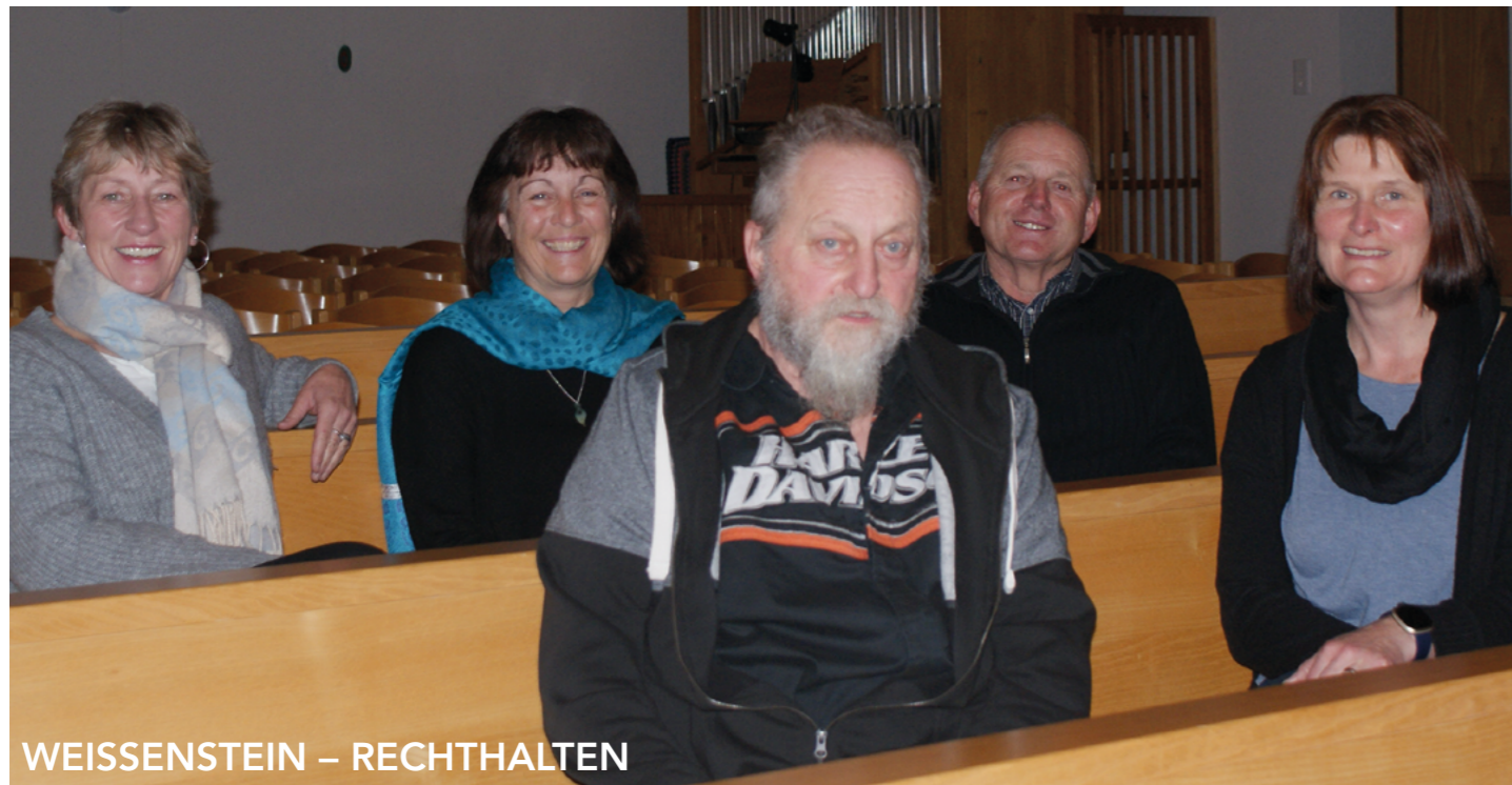
WEISSENSTEIN – RECHTHALTEN