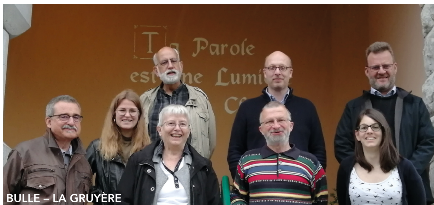
BULLE – LA GRUYÈRE