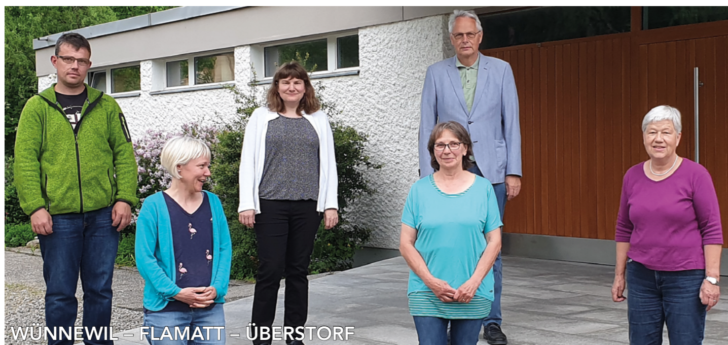
WÜNNEWIL – FLAMATT – ÜBERSTORF