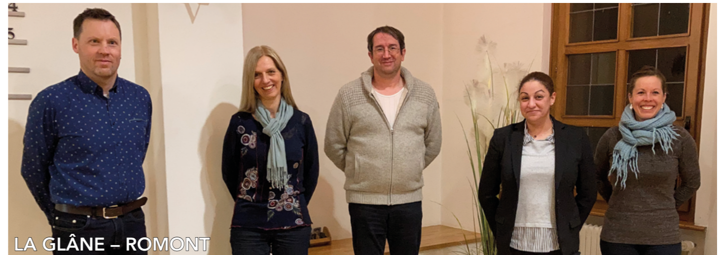
LA GLÂNE – ROMONT