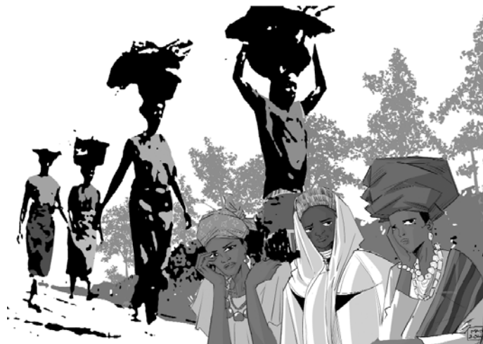
L'artiste nigériane Gift Amarachi Ottah a conçu pour cette occasion une illustration saisissante intitulée «Du repos pour les femmes épuisées» .

Sous le titre «Je veux vous fortifier. Venez !» , un appel tiré de la célèbre parole biblique de Jésus: «Venez à moi, vous tous qui peinez sous le poids du fardeau, et moi, je vous donnerai le repos.», (Mt 11,28), ces femmes Nigériennes évoquent dans la liturgie de cette célébration leur fardeau quotidien et comment elles trouvent dans la foi «le repos de l'âme».