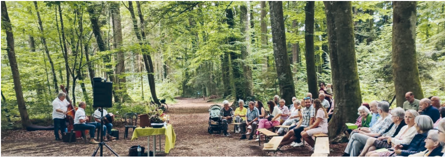
Waldgottesdienst Galmguet Jeuss am 20. Juli 2025

Aussen- und Waldgottesdienste fanden wie jedes Jahr in Muntelier, Ried bei Kerzers, Lurtigen, Salvenach und im Wald beim Pflegeheim Jeuss statt. Diese Gottesdienste sind sehr beliebt für Taufen, wie sich auch in diesem Jahr gezeigt hat.