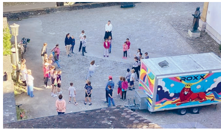
Gemeinsames Spielen am Morgen

Wir suchen motivierte Freiwillige, die tageweise zum Helfen kommen: beim Zvieri, in der Küche, beim Basteln und beim Spielen. Hast du Lust, unser Team zu ergänzen? Wir freuen uns auf dich.