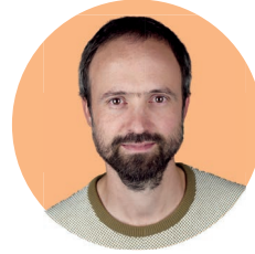
Martin Nous Pasteur

Feurig, wenn nicht hitzig, darf drum an Pfingsten debattiert werden, welche Werte wir eigentlich leben wollen. Eine kleine Flamme Liebe könnte sich dadurch ausbreiten zum Flächenbrand. Heilsames Feuer für die zerstrittene Welt. Ein Zündhölzli reicht.